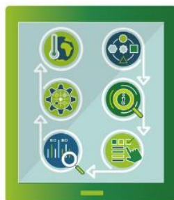
Regional Adaptation Support Tool