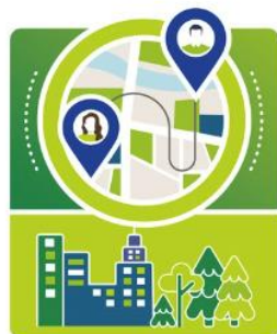
Regions and Local Authorities