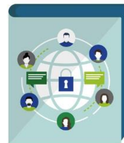
Community of Practice