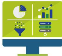
Knowledge and Data